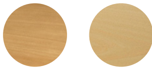
03 / Roble